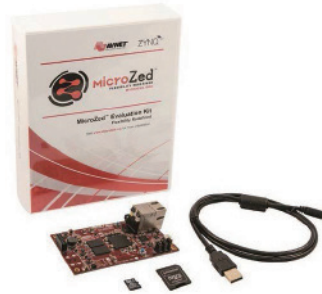
Avnet MicroZed™ 评估套件