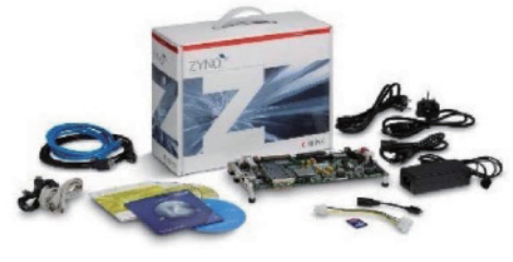
赛灵思 Zynq-7000 All Programmable SoC ZC706 评估套件