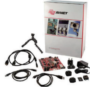
Avnet MicroZed 嵌入式视觉开发套件