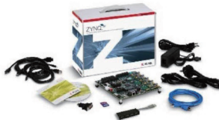
赛灵思 Zynq-7000 All Programmable SoC ZC702 评估套件

赛灵思及其联盟合作伙伴提供广泛的评估套件，用以快速开发基于 Zynq-7000 AP SoC 的高度差异化嵌入式应用。套件包含硬件、设计工具、IP 和预先验证的参考设计的全部基础组件。如需了解更多信息，敬请访问： china.xilinx.com 的 Zynq-7000 AP SoC 开发板与套件 。