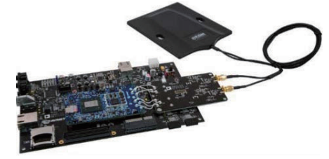
Avnet PicoZed SDR SOM Z7035/AD9361 开发套件